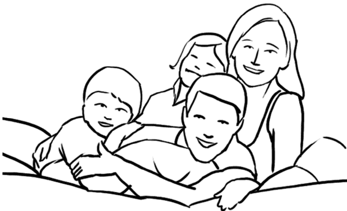
۱۸- یک ژست ساده دیگر.