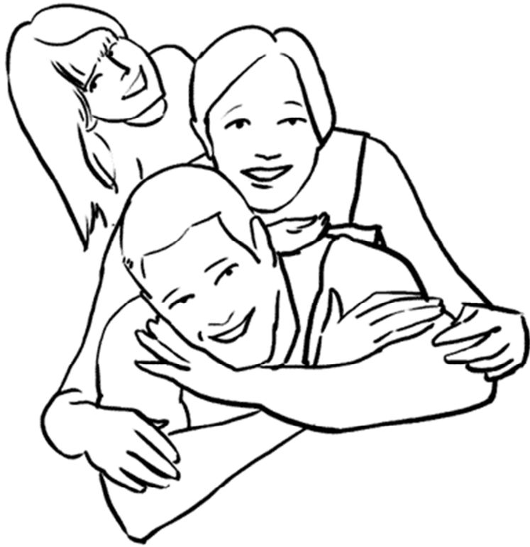
۱۶- ژستی فوق العاده راحت با آرامش فراوان.