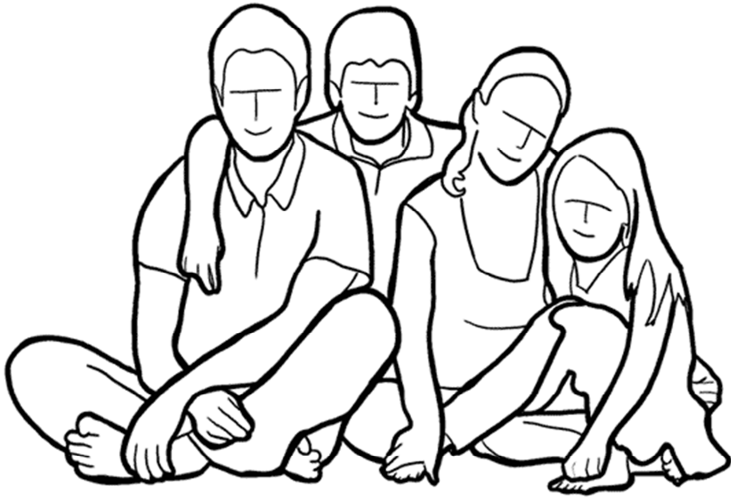
۱۴- یک ژست ساده و زیبای فامیلی.