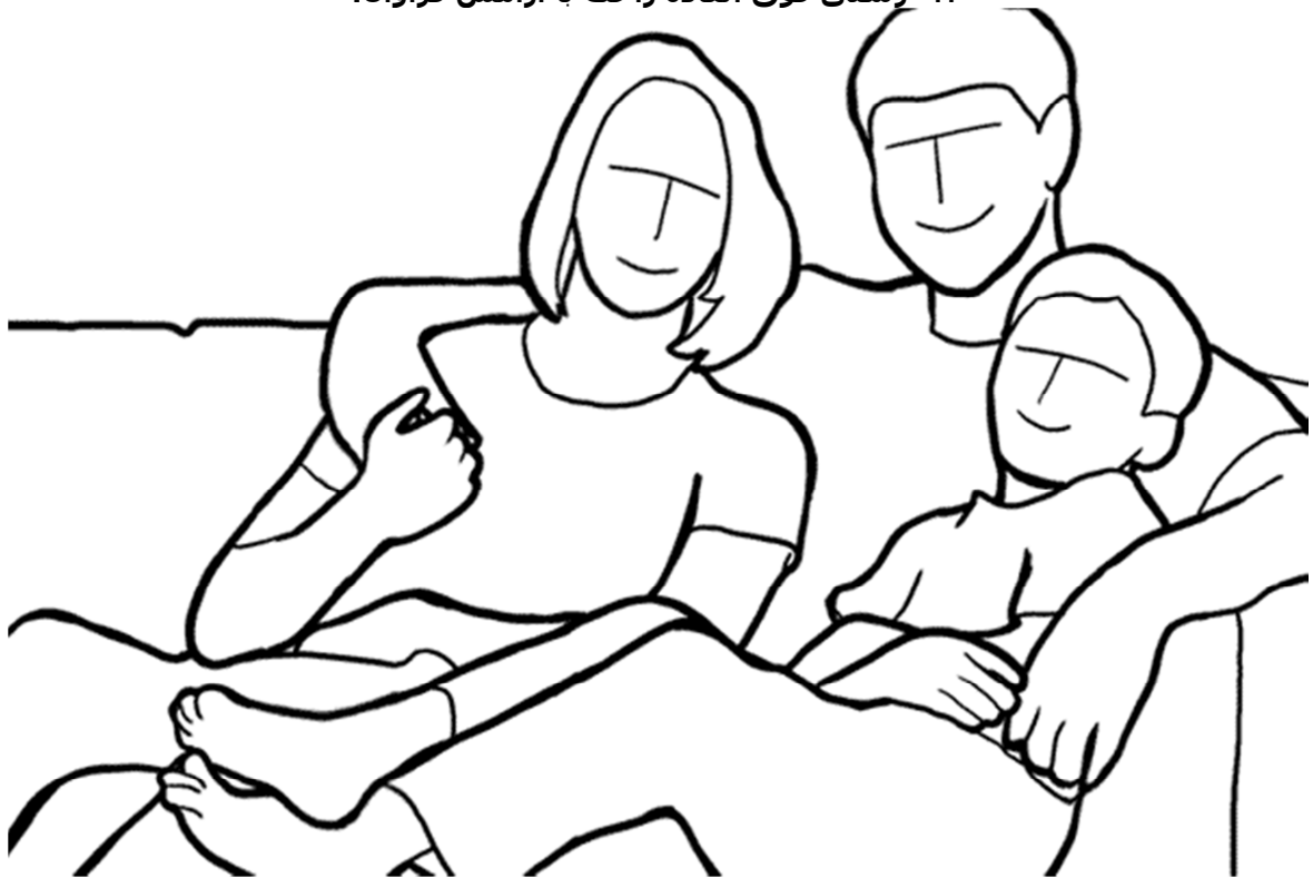
۱۷- ژستی متفاوت برای جمع های فامیلی.