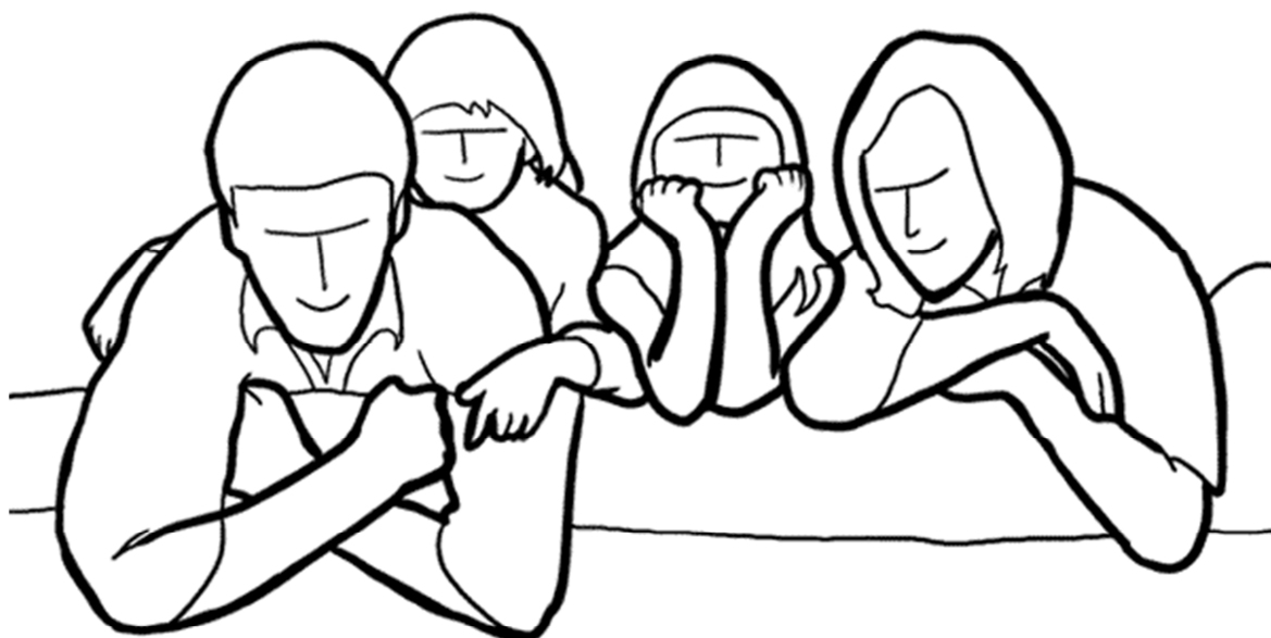
۱۹- یک ژست جذاب زمانی که به خارج از خانه می روید. بزرگترها کودکان را گولی کنند و رو به دوربین لبخند بزنند.